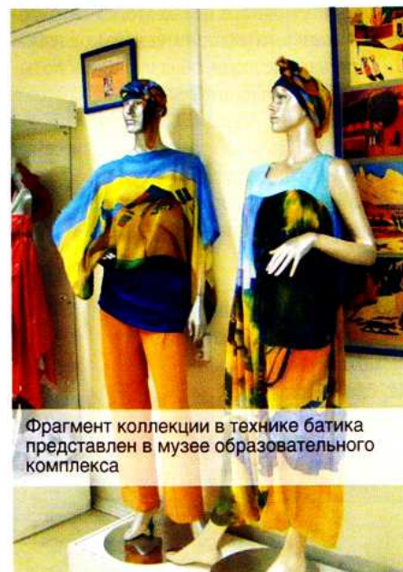
Фрагмент коллекции в технике батика представлен в музее образовательного комплекса

как для детей, так и для родителей: ребенок только пошел в школу, а уже можно многое узнать о специальностях, которые есть возможность освоить в будущем. При этом мы не настаиваем, чтобы все дети после школы поступали к нам в колледж, свобода выбора никак не ограничивается.