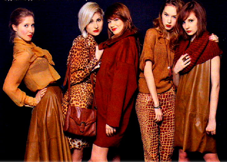
Одна из дипломных коллекций

Есть проблемы экономического характера – сложно организовать свой бизнес, наладить продажи. Этому нужно еще учиться. Вот мы сейчас хотим завязать контакт и сотрудничать с международным институтом дизайна и менеджмента во Флоренции