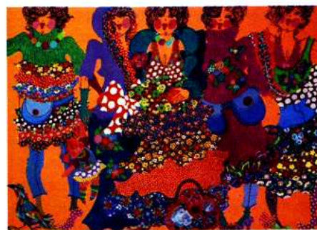
Эскизы дипломных коллекций