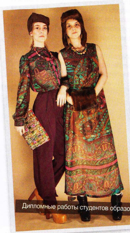
Дипломные работы студентов образовательного комплекса

Цель этого конкурсного дефиле, с одной стороны, посмотреть и оценить, что мы сделали за год, что получилось хорошо, что не очень, куда мы движемся. С другой стороны, это прямой контакт выпускников с работодателями, некий промоушен: вместе с подарками и призами молодые дизайнеры получают приглашения на работу, на участие в престижных конкурсах, на членство