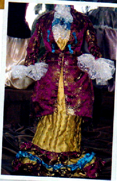
Работы студентов по материаловедению и истории костюма

именно с целью получить больше знаний в области менеджмента и маркетинга в производстве одежды.