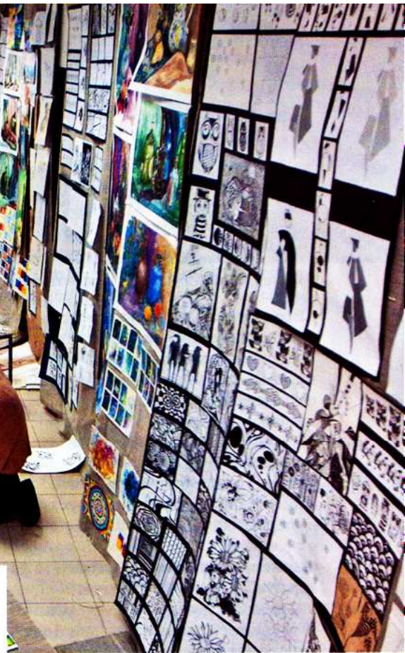
Развеска – экзамен по художественным дисциплинам

в Союзе дизайнеров и т.д. Кроме того, они получают множество рекомендаций, происходит открытый свободный диалог с опытными специалистами.