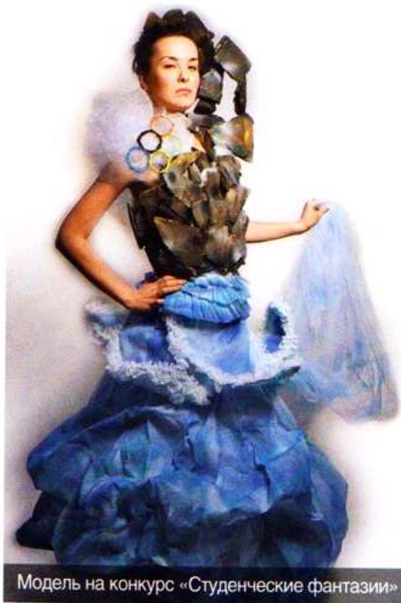
Модель на конкурс «Студенческие фантазии»