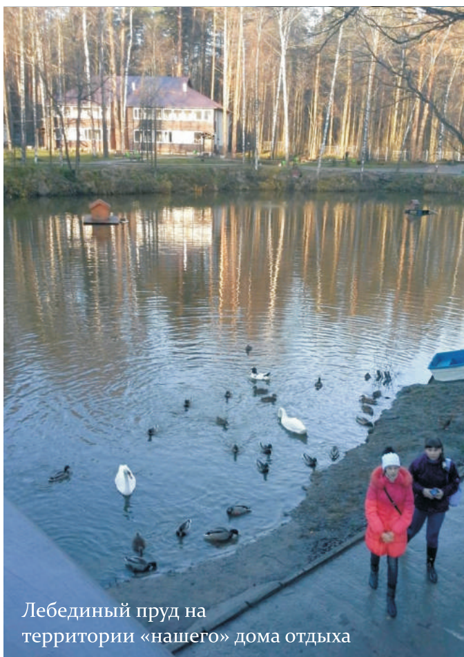
Лебединый пруд на территории «нашего» дома отдыха