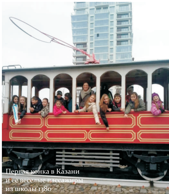
Первая конка в Казани и ее веселые пассажиры из школы 1380