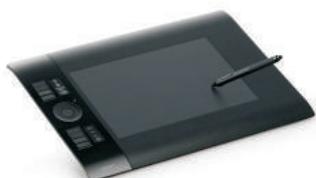
Графический планшет Intuos 5