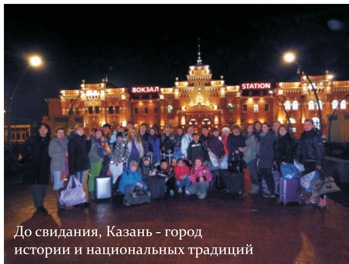
До свидания, Казань - город истории и национальных традиций