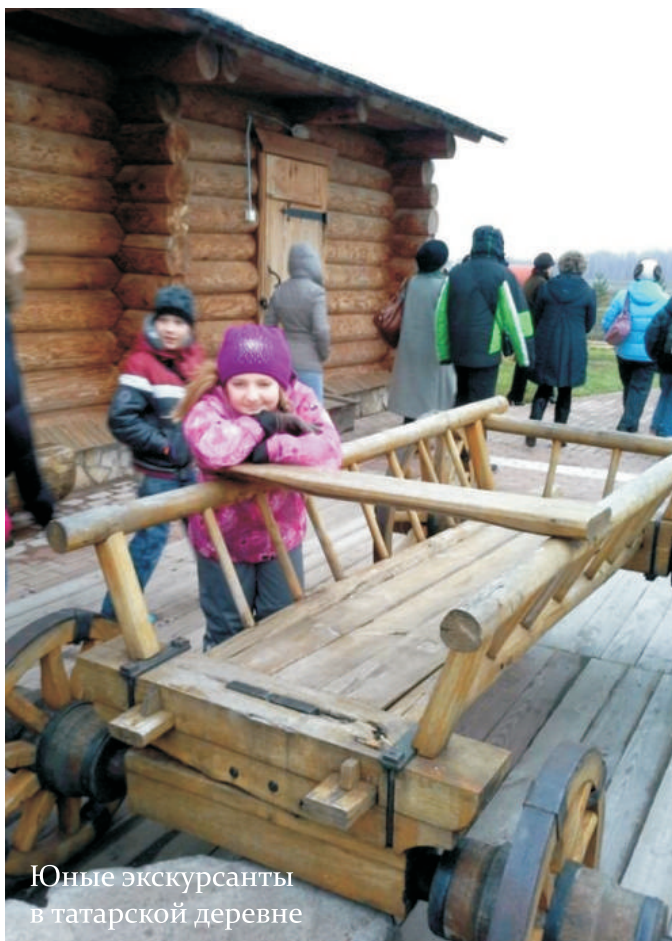
Юные экскурсанты в татарской деревне