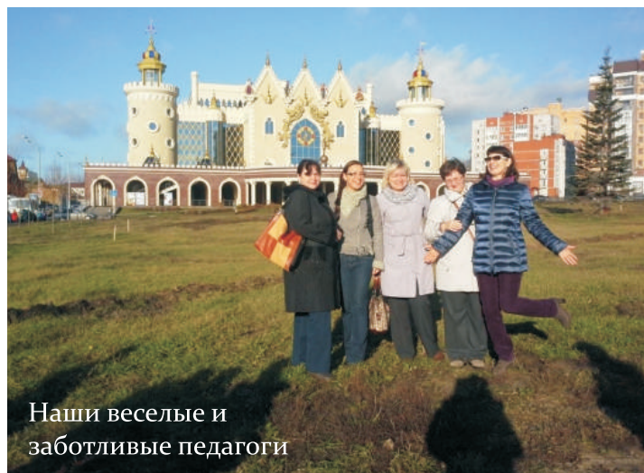
Наши веселые и заботливые педагоги