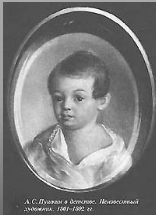
А. С. Пушкин в детстве. Неизвестный художник. 1801-1802 гг.