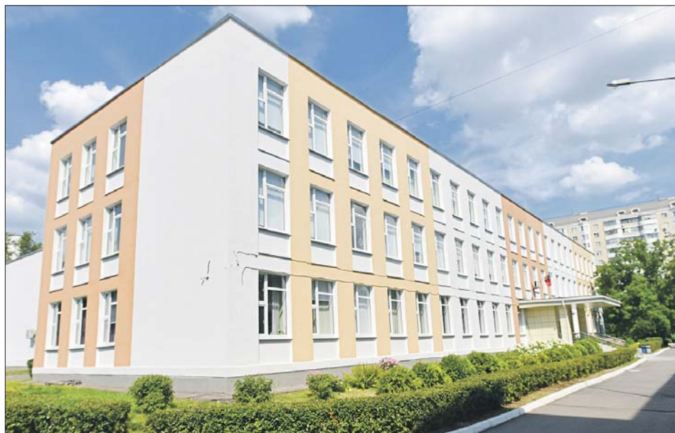
Тот самый школьный корпус, где развернулось действие картины, на улице Тихомирова